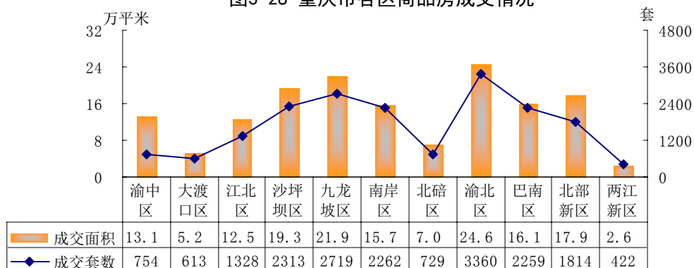
图3-28 重庆市各区商品房成交情况

从重庆市各区商品房成交情况来看，本月，渝北区、九龙坡区、沙坪坝区、南岸区、巴南区、北部新区等区成交量较大，分别成交房屋3360套、2719套、2313套、2262套、2259套、1814套，成交面积分别为24.6、21.9、19.3、15.7、16.1、17.9万平方米。